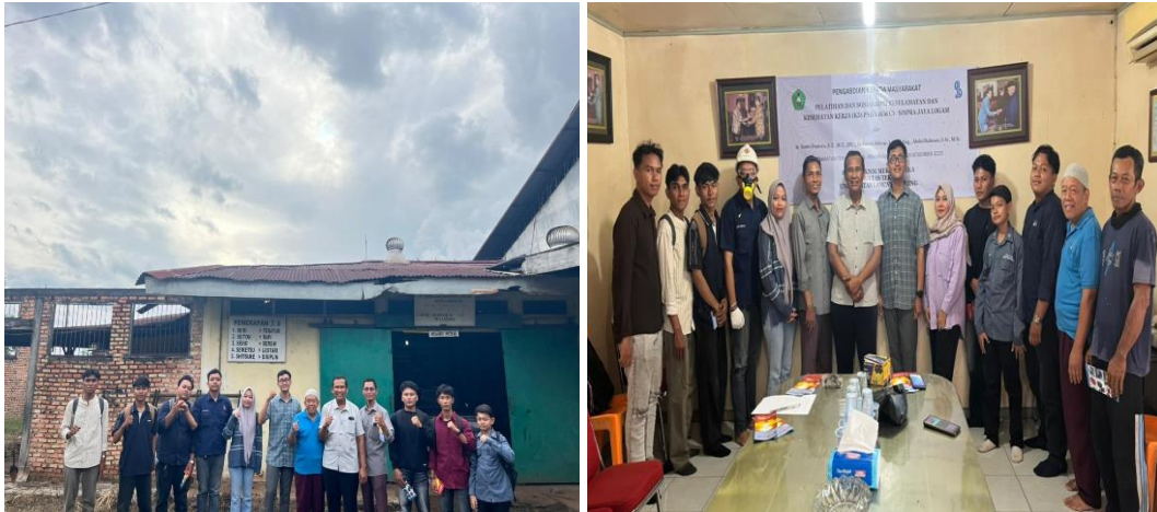
Gambar 2. Foto Bersama Karyawan CV. Sispra Jaya Logam

goggle , sarung tangan tahan panas, dan sepatu keselamatan secara mandiri setelah diberikan demonstrasi langsung oleh tim pengabdian.