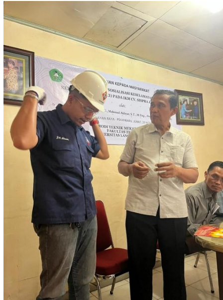
Gambar 1. Pelaksanaan Demonstrasi Penggunaan APD

Evaluasi dilakukan untuk melihat sejauh mana materi pelatihan dapat diserap oleh peserta. Standar penilaian didasarkan pada tingkat penguasaan materi selama sesi tanya jawab dan praktik langsung.