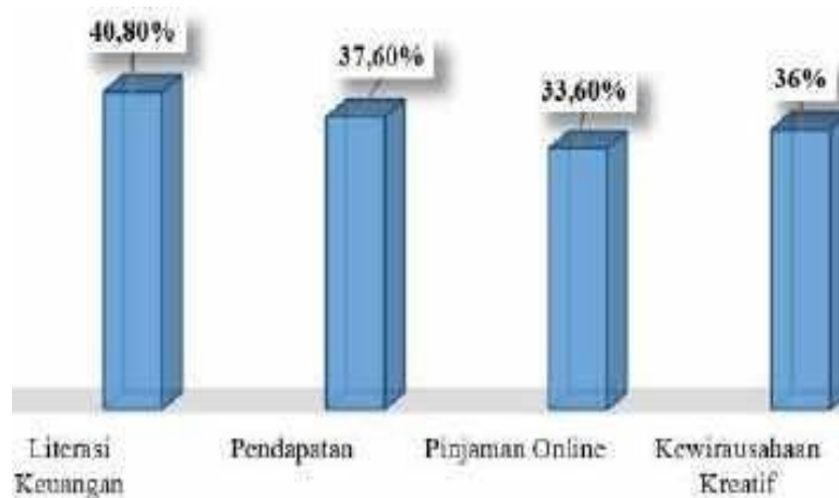
Gambar 2. Grafik Baseline Existing Mitra

Penguatan baseline existing mitra dilakukan dengan mengisi pre test serta observasi secara langsung yang dilaksanakan pada 11–12 Juni 2022. Dokumentasi kegiatan observasi secara langsung. Adapun hasil pre-test dan observasi langsung didapatkan bahwa masih banyak ibu-ibu PKK belum memahami mengenai literasi keuangan, pendapatan mitra, pinjaman online , dan kewirausahaan kreatif. Hasil pemahaman mitra kami sesuai pre-test dapat dilihat sebagai berikut.